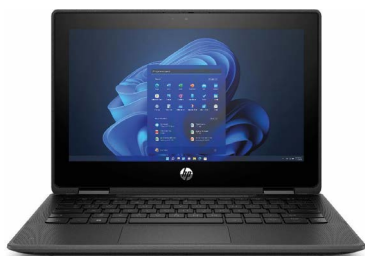
HP Pro Fortis G9 x360 touch