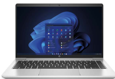
HP Probook 445 G9